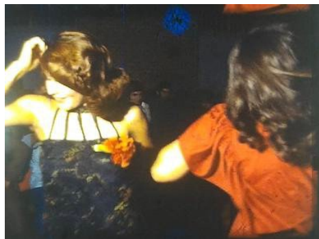
Ma planète volée. Film de Farhanaz Sharifi. Iran